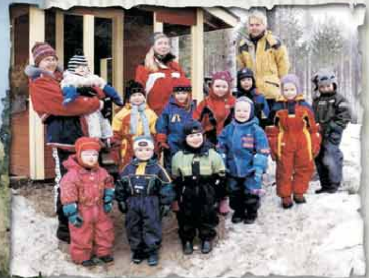
Nuppulaiset ovat meidän kaikkien "pikkuisia". Koululaiset ovat usein käyneet Nupun ja muistavat miten hienolta tuntui kun koululaiset pihalla leikkivät heidän kanssaan. Näin perinne jatkuu.