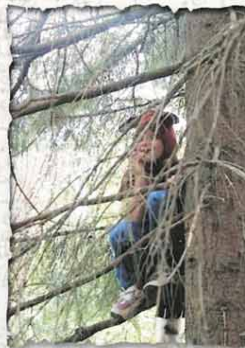
Koulun metsässä on lapsilla oma "majamaailma", jonka he ovat itsenäisesti luoneet ja siellä on pesä myös oravalla.